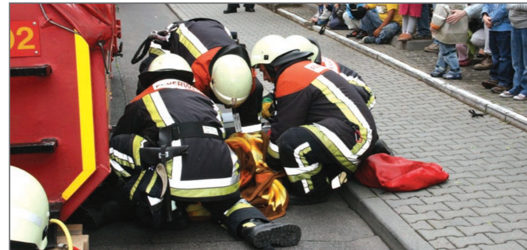
Bei den Tagen der offenen Tür zeigte die Freiwillige Feuerwehr Dietesheim ihr Können.