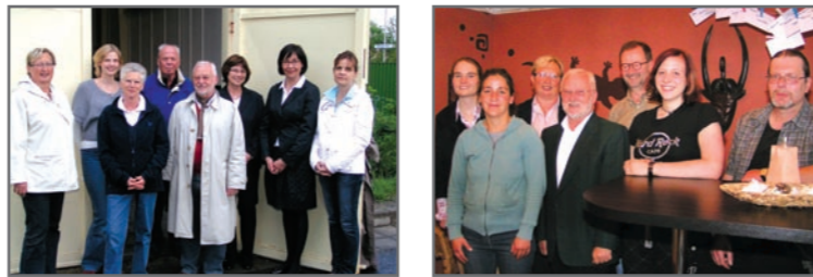
Lebensladen - Leitprojekt 10.

Verteilung von überschüssigen Lebensmitteln und Bedarfsgütern sowie geeigneten Aktionen geholfen werden. Der Name „Lebensladen“ signalisiert, dass man den Verein unabhängig von Vorgaben der Tafel-Bewegung gründen und nicht allein die Lebensmittelverteilung im Blick haben will. Der „Lebensladen“ ist ein Projekt der Evangelischen Friedensgemeinde.“ „Um auf das Leitbildergebnis der Stadt zu reagieren, wo deutlich der Wunsch der Jugendlichen nach einer Einrichtung zum Treffen festzustellen war, wurde am 31. März 2009 der Verein „Jugendcafé Dietesheim“ gegründet. Der Verein bewarb sich als Projekt für die 72 Stunden Aktivität der Katholischen Jugend. Er bekam den Zuschlag und vom 08.