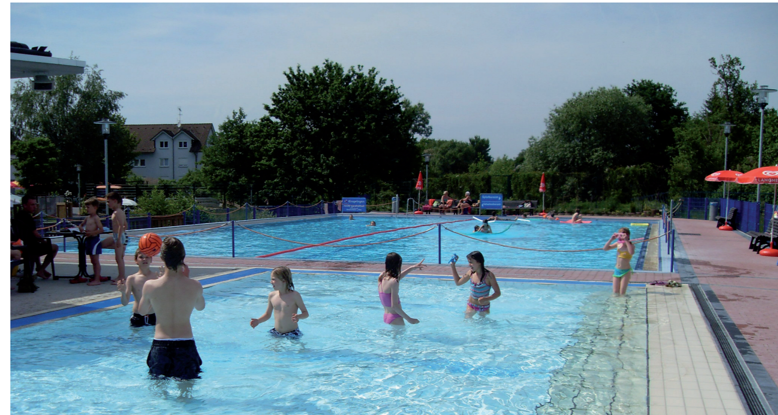
Nicht nur in den Ferien ein beliebter Treffpunkt für Jung und Alt: das Freibad in Lämmerspiel.

Kinder-Triathlon, Sommerkino „Nachts im Museum 2“ und andere Höhepunkte