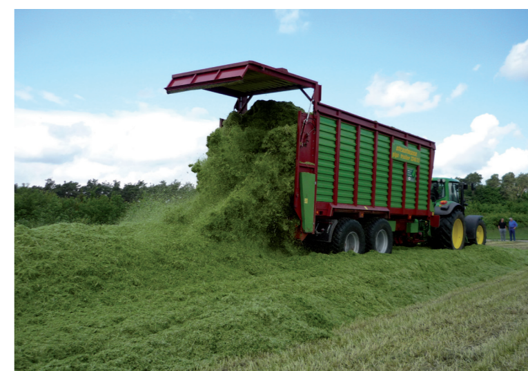
Es wird weiter intensiv am Projekt Biogas gearbeitet.