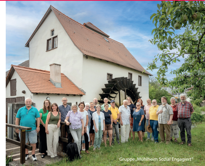
Gruppe „Mühlheim Sozial Engagiert“

Logo MSE: © Klaus Puth | Gruppenfoto Vorderseite: © Katrin Schander